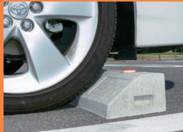
ドレスアップパーツ装備車の前向き駐車も安心