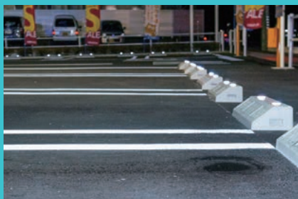
どの向きからでも反射します