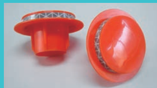
レフキャップ (全周反射高輝度キャップ)