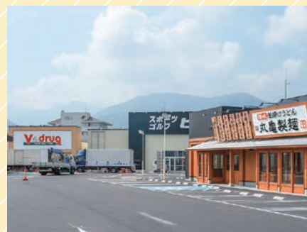
クロスガーデン中津川