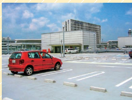
中部国際空港セントレア