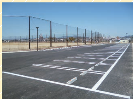
可児市土田渡多目的広場